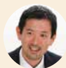
香坂 玲氏 東京大学大学院 農学生命科学 研究科 教授