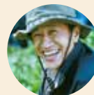
岡野 隆宏氏 環境省 国立公園課 国立公園利用推進室長