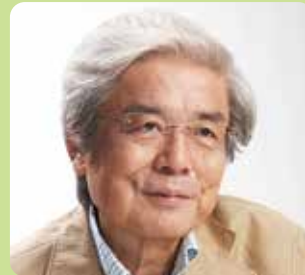
ようろう たけし 養老 孟司 『森里川海大好き!』編集委員会 委員長